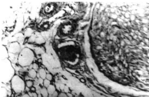
Рис. 2. Мікрофото. Жирові клітини аспірату в тканинах ендоневрію через 14 днів після операції. Периневрій та адипозити без суттєвих змін. Забарвлення гематоксилином та еозином

Оскільки трансплантація жиру ще маловідома методика, наводимо детальну техніку її виконання.